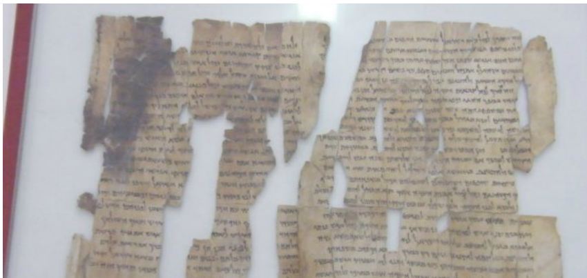
Frammenti dei manoscritti del Mar Morto

Manoscritti del Mar Morto: un nuovo studio sul DNA degli animali utilizzati per creare pergamene e papiri potrebbe portare a nuove grandi scoperte sui reperti ritrovati a Qumran.